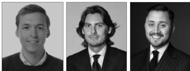
Frederik Plum Specialist, Watches